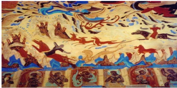
ภาพจิตรกรรมฝาผนังในถ้ำโมเกา

ภัณฑารักษ์ของพิพิธภัณฑ์หุบถ้ำโมเกาจะอนุญาตให้เข้าชมประมาณ ๘-๑๐ ถ้ำ โดยคัดเลือกถ้ำที่น่าสนใจของแต่ละยุคสมัยเปิดให้เข้าชม