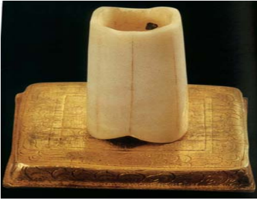
พระบรมสารีริกธาตุขื่อนิ้วพระหัตถ์