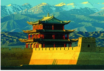
เจียวูเกวณด่านสุดท้ายกำแพงเมืองจีน