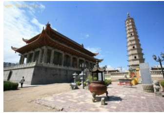
วัดพระกุมารชีพ

เยี่ยมชม ★สุสานเหลียงไถ 雷台古汉墓 Leitai Han Tomb สมัยราชวงศ์ฮั่นตะวันตก ในเดือนตุลาคม ปีค.ศ.๑๘๖๘ ได้มีการขุดค้นพบหลุมฝังศพแม่ทัพสมัยราชวงศ์ฮั่นตะวันตกเข้าไปโดยบังเอิญ สิ่งสำคัญที่ได้พบในสุสานแห่งนี้คือ รูปหล่อทองเหลืองอาชาของ 铜奔马 ที่เรียกขานกันว่า “หมาท่าเพยเอี้ยน” 马踏飞燕 หรือ “ม้าเหยียบนกนางแอ่นเหินลม” อันเป็นม้าสวรรค์ตะวันตก สิ่งสุดยอดปรารถนาของจักรพรรดิในสมัยราชวงศ์ฮั่น มีรูปลักษณะสง่างามในท่วงท่ากำลังกระโจนทะยานมุ่งไปเบื้องหน้าอย่างทรงงองอาจ เท้าทั้งสามกำลังเหยียบย่ำอยู่กลางนภา เท้าที่สี่เหยียบอยู่บนเนื้อตัวนกนางแอ่นที่กำลังถลาลม มีรูจมูกเปิดกว้าง และปากกำลังพ่นควันระบายนอกมา ร่ำลือกันว่าเหยี่ยวของม้าสวรรค์นี้มีสีแดงประดุจชาติ ไนยามที่ส่งเสียงร้องอย่างคึกคะนองนั้น สามารถสยบม้าของศัตรูให้หมอบราบคาบได้โดยง่ายดาย “หมาท่าเพยเอี้ยน” คือสัญลักษณ์ของเมืองหวู่เว่ย ของการท่องเที่ยวประเทศจีน และเส้นทางสายแพรไหมอันยาวไกล