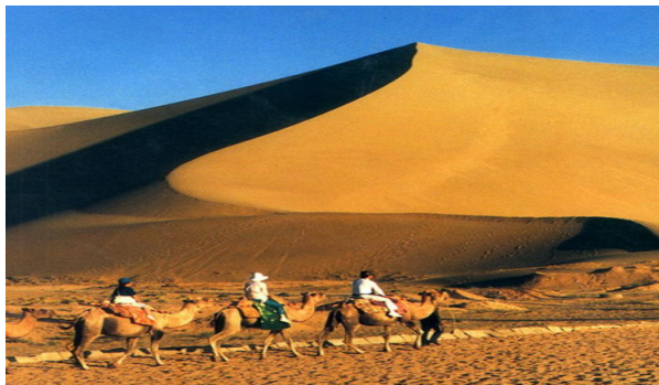
ที่อุรุสองหนอก เลียบไปตามผืนทรายหิงซาซาน

จากนั้น เดินทางไปสู่อุรุสองหนอก เลาะตาม ★ หิงซาซาน 鸣沙山 Mingsha Shan หรือ ภูเขาทรายร้องได้ ชมทัศนียภาพของเนินทรายหิงซาซานยามบ่ายอันงดงาม สัมผัสประสบการณ์ การเล่นไม้สไล่อันน่าตื่นเต้นจากเนินทรายลงสู่ด้านล่าง ชม ★ เยว่หยางฉวน 月牙泉 Yueya Quan สระน้ำเสี้ยวจันทร์ รูปทรงดั่งพระจันทร์เสี้ยวกลางผืนทรายที่มีเหือดแห้งมาแต่โบราณ