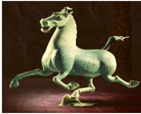
ม้าสวรรค์ตะวันตก

วันนี้เดินทาง ๒๘๐ กม. ใช้เวลาประมาณ ๓.๕ ชม. จากนครหลานโจว สู่ ★เมืองหวู่เว่ย 武威 Wuwei ในอดีตเรียก เหลียงโจว มีชื่อเสียงในฐานะเมืองประวัติศาสตร์บนเส้นทางสายแพรไหม และเป็นแหล่งเพาะเลี้ยงจามรีขนสีขาวชั้นดีของประเทศ ในอดีตเคยใช้เป็นเส้นทางเดินทางไปสู่ดินแดนทิเบตทางตอนใต้