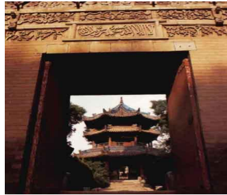
สุเหร่าซีอาน

ความสุขและความเจริญแห่งยุคสมัย ได้ปรากฏโฉมออกมาให้เห็นสู่สายตาสาธารณชนอย่างเป็นทางการ เมื่อปลายปี ค.ศ. ๑๙๙๙ ที่ผ่านมานั้นคือ การเปิด สุสานอันหยางหลิง ของพระองค์ เอกลักษณะที่สร้างชื่อเสียงให้กับอันหยางหลิงคือ กองทัพสัตว์ดินเผา คือ สุกร แกะ แพะ หรือแม้แต่สุนัข ไก่ ถูกฝังเรียงแถวไว้อย่างเป็นระเบียบ เช่นเดียวกับกองทหารและข้าทาสขององค์จักรพรรดิ โดยเฉพาะหุ่นรูปบุรุษ สตรี และขันที มีขนาดเล็กสูงเพียงประมาณ ๖๒ ซม. หุ่นทุกตัวจะมีใบหน้าเปื้อนรอยยิ้มสะท้อนให้เห็นถึงความสุขแห่งยุคสมัยโดยแท้จริง (ต่างจากกองทหารม้าดินเผาของจักรพรรดิฉินซี ที่มีสีหน้าเคร่งเครียดจริงจัง)