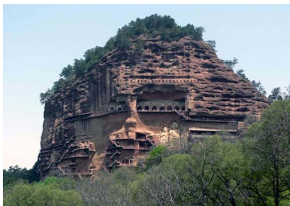
หมู่พุทธคณาไมจีซาน

ชม ☺ ศาลเทพเจ้าฟูซี 伏羲庙 Fuxi Miao ☺ อันศักดิ์สิทธิ์และขึ้นชื่ออันดับหนึ่งของเทียนสู่ย จากนั้น เดินทางเยือน