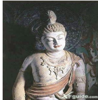
หนึ่งในงานสถาปัตยกรรมชิ้นเยี่ยมภายในถ้ำ

ความรุ่งเรืองของตุนหวงมีอาจแยกออกจากความจำเจของ ★หมู่ถ้ำพระศัพทโมเกา 莫高石窟 Mogao Grottoes ตั้งอยู่จากตัวเมืองตุนหวงประมาณ ๒๕ กม. มีความจำเจอยู่ยาวนานตั้งแต่คริสต์ศตวรรษที่ ๔-๑๔ เป็นถ้ำที่เกิดจากฝีมือ