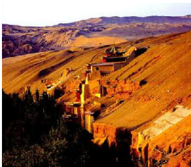
หมู่ถ้ำโมเกา

จากเมืองเจียวูเกวณ มุ่งหน้าต่อไปบนเส้นทางระเบียงเหอซี สองฝั่งเป็นทะเลทรายเว้งว่างสุดสายนอกเขตกำแพงเมืองจีนอันสูงชัน ใช้เวลาเดินทาง ๕ ชม. ระยะทาง ๓๔๐ กม. ผ่านเมืองอวี๋เหมิน กวอโจว ไปจนถึง ★เมืองตุนหวง 敦煌 Dunhuang จุดยุทธศาสตร์สำคัญบนเส้นทางสายแพรไหม ที่นักเดินทางมาจาก นครฉางอาน ใช้เป็นสถานที่หยุดพัก เพื่อจัดเตรียมเสบียงทั้งกองคาราวานคนและสัตว์ต่างให้พร้อม ก่อนเดินทางรอนแรมผ่านทะเลทรายและเลียบขุนเขาอันยาวไกล ในเวลาเดียวกัน นักเดินทางที่มาจากทางตะวันตกที่ผ่านความทุรกันดารมายาวนาน ก็ต้องเตรียมกองคาราวานให้พร้อมก่อนเดินทางไปตามเส้นทางระเบียงเหอซี หรือ เหล่าแม่ทัพนายกองผู้ถูกส่งไปประจำการที่ด่านชายแดนต้องมาหยุดพักกันที่เมืองนี้ จึงทำให้ตุนหวงมีความเจริญมาตั้งแต่สมัยราชวงศ์ฮั่น ต่อเนื่องมาในสมัยจิ้น เป่ย์เว่ย สุย ถึง จนถึง หยวน และ หมิง