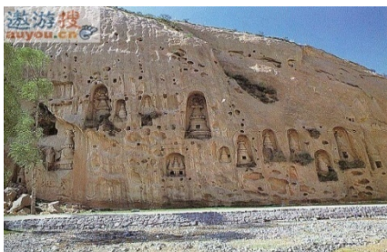
หมู่พุทธคูหาหมาลีซือ เมืองจางเย

เดินทางไปบนเส้นทางระเบียงเหอซี จากเมืองหวู่เว่ย สู่ ★เมืองจางเย Zhangye ระยะทาง ๒๗๕ กม. ใช้เวลาประมาณ ๓.๕ ชม. ถึงเมืองจางเย หรือ กานโจวในอดีต นำชมพุทธสถานสำคัญของจางเยสองแห่ง คือ ★วัดพระใหญ่-ต้าฝอซือ 大佛寺 Dafo Si สร้างในปีค.ศ.๑๐๘๘ สมัยซีเซี่ยภายในวิหารใหญ่เป็นที่ประดิษฐานของพระนอนศักดิ์สิทธิ์องค์ใหญ่ที่สุดของประเทศจีน มีความยาว ๓๔.๕ ม. พระอังกากว้าง ๗.๕ ม. พระกรรณยาว ๔ ม. พระบาทยาว ๕.๒ ม.