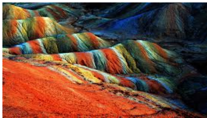
เขตภูมิทัศน์จางเย่ต้นเสียดี้เม่า