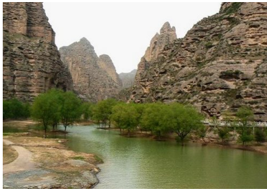
วัดปิ่งหลิงริมแม่น้ำเหลือง

เช้านี้เดินทางด้วยรถยนต์ประมาณ ๓๕๐ กม. ใช้เวลาประมาณ ๔ ชม.ครึ่ง ขึ้นไปทางตะวันตกเฉียงเหนือ สู่ นครหลานโจว 兰州 Lanzhou เมืองเอกของ มณฑลกลานซู่ 甘肃 Gansu บนสองฝั่งแม่น้ำหวงเหอ (เหลือง) หลังอาหารเช้า เดินทางลงใต้ ระยะทาง ๘๐ กม. ไปถึงสถานีหัวเขื่อนหลิวเจียเสี๋ย เขื่อนแห่งแรกที่สร้างขึ้นกั้นแม่น้ำเหลือง จากนั้น ลงเรือเร็วจากเขื่อนล่องไปตามมาตุธารหวงเหอ ระยะทางประมาณ ๖๐ กม. เพื่อไปยังวัดปิ่งหลิง จุดข้ามแม่น้ำเหลืองของผู้คนเมื่อกาลก่อน ตื่นตาไปกับฉากธรรมชาติอันยิ่งใหญ่งดงามรายรอบวัดปิ่งหลิงบนสองฝั่งหวงเหอ ซึ่งถูกโอบล้อมด้วยป่าภูเขาทรายจีสี้อซานฉวินเฟิง – เป็นหนึ่งในภูมิทัศน์มหัศจรรย์ของกานซู่