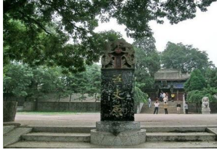
ศาลของเบ้ง ณ อุ้งจี้หยวน