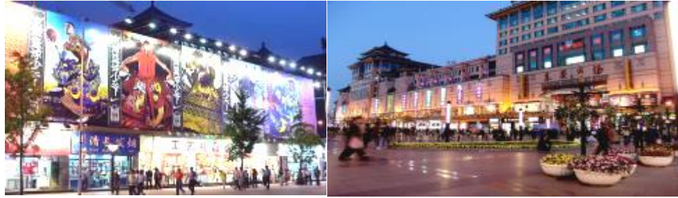
พัก Holiday Inn Hotel หรือ Yitel Hotel 4 ดาว หรือเทียบเท่า

ค่ำ 10 รับประทานอาหารค่ำ ณ ภัตตาคาร จากนั้นนำท่านเที่ยวชมย่านการค้าที่เจริญที่สุดของปักกิ่ง หวังฝูจิ่ง มีห้างสรรพสินค้าใหญ่หลายห้าง และร้านค้าอื่นอีกมากมาย มีสินค้าให้ท่านได้เลือกซื้ออย่างจุใจ