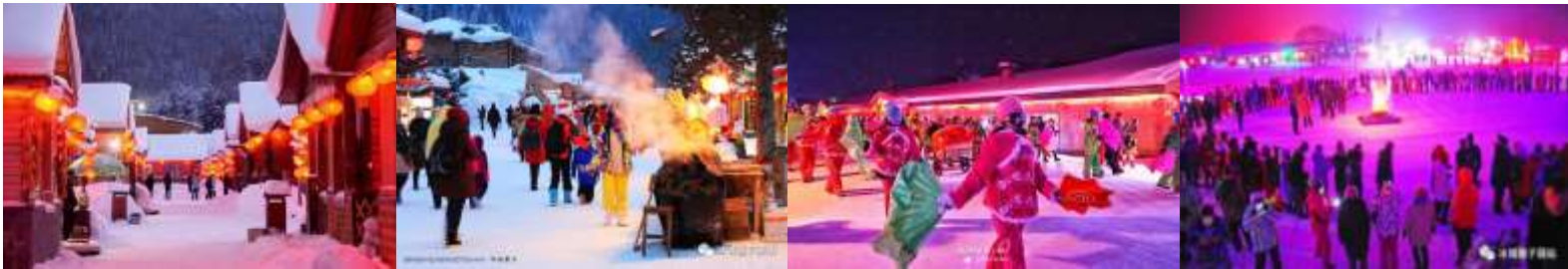
☞ พักที่เสวียเซียง 雪乡雪韵阁大酒店 - Xuexiang Xueyunge Hotel หรือเทียบเท่า

หลังอาหาร ท่านสามารถอิสระชมและถ่ายรูปกับบรรยากาศแสงไฟยามราตรีภายใน “เมืองหิมะ”