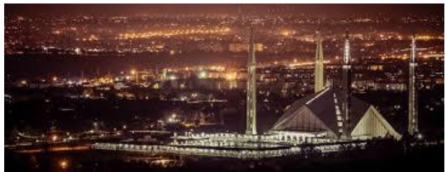
พักอิสลามาบัต Blue Area : De pape หรือเทียบเท่าระดับ 4 ดาว

วันที่สอง พฤหัสบดี 27 ตุลาคม 2565 อิสลามาบัต- คาราโครัมไฮเวย์ – กิลกิต