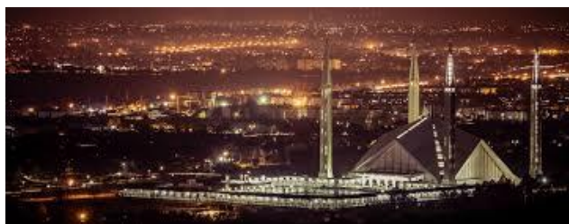
พักอิสลามาบัต Blue Area : De pape หรือเทียบเท่า

22.10 น. ถึง อิสลามาบัต ปากีสถาน หลังนำท่านผ่านพิธีตรวจคนเข้าเมือง รับสัมภาระแล้ว นำท่านสู่ที่พัก กรุงอิสลามาบัต (Islamabad) สร้างขึ้นในคริสต์ทศวรรษ 1960 เป็นเมืองที่มีการวางผังเมืองไว้ก่อน เพื่อเป็นเมืองหลวงของประเทศแทนนครการาจี มีมาตรฐานการดำรงชีพ ความปลอดภัยสูงและเป็นที่ตั้งขององค์กรทางการเมืองของประเทศ